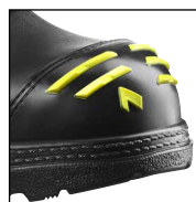
HAIX® High Durability Cap System